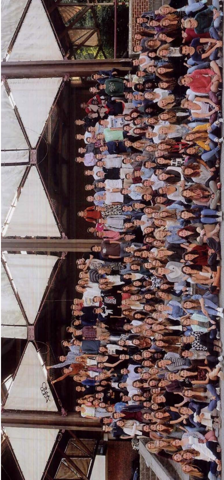
LYCEE MARTIN V 2014-2015